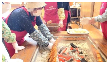
べっぴんカフェ4月の市