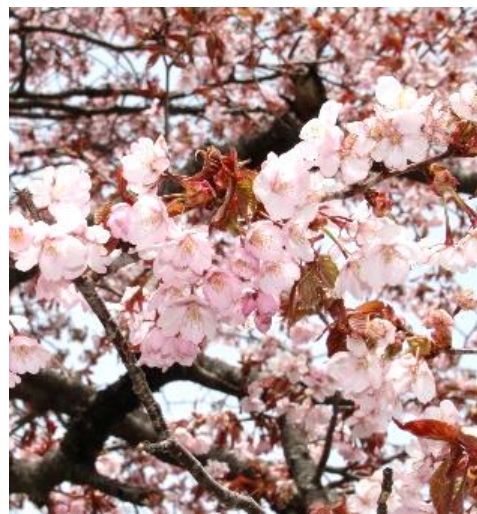
満開の山根一本桜

澄み切った青空と牧草の緑に桜のピンク色が映え、その美しいコントラストに参加した皆さんは、「きれいだね」「今年は丁度咲いてよかったね」と、満開の桜に笑顔の花を咲かせていました。