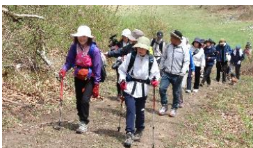
山根一本桜トレッキング