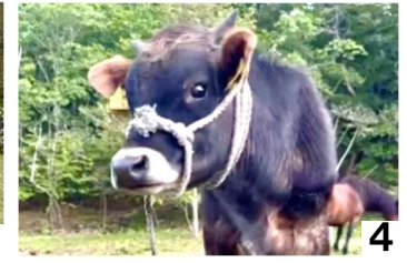
1 牛への餌やり「たくさん食べてね」／ 2 間近の牛に笑顔の児童／ 3 ジャージー牛の「かぬか」(メス)／ 4 同じく「やませ」(オス)