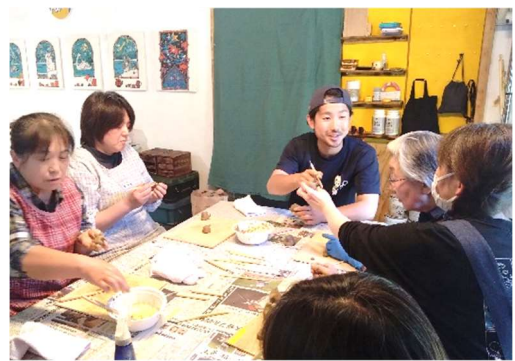
和気あいあいと制作する参加者

隣接するカフェ SORAMAME（そらまめ）のドリンクを持ち込むこともできますので、散歩がてら気軽に立ち寄り、アートを楽しんでみませんか。