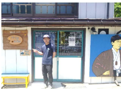
SORAMAME 隣のギャラリー入口