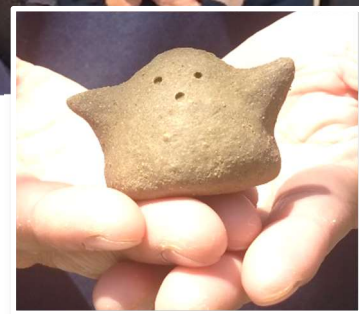
ワークショップで制作した 手持ちサイズのハニワ