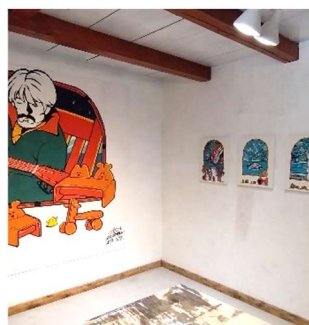
山根を描いた作品がずらり