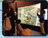
久慈地下水族科学館 もぐらんびあ

白い灯台 若いころの春子が不満を書きなぐった場所 アキが自転車で飛び込んだ場所 最終回でアキとコイが立つ場所