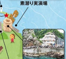
小袖海女センター

監視小屋 ヒロシがバイトしていた小屋 夏ばっばと春子がアキの素潜りの様子を双眼鏡で見守る場所