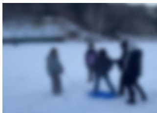
朝、元気に雪遊びをする子供たち