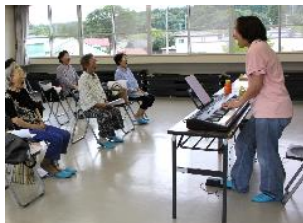
ボイストレーニング