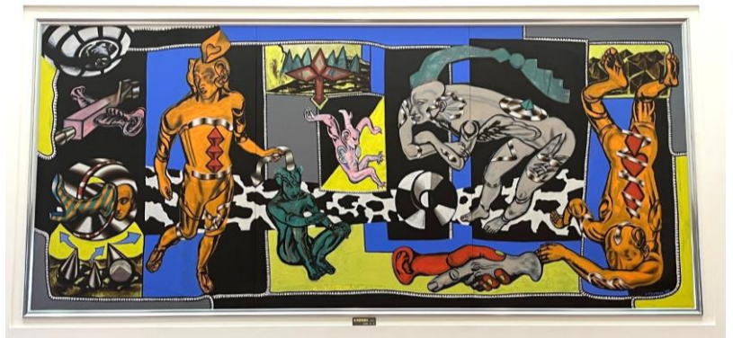
生物圏保護区 No.257（アンバーホール大ホールホワイエ）

宇津宮氏の近作の一貫したテーマは「生物圏保護区」と題され、浮動する画像、種々の色に染められた身体とマスクは、生物圏保護区にあって、常に変動する独創的存在の至福状態を現わしている。本作は「生物圏保護区」の257作目となる。