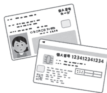
マイナンバーカードに印鑑登録証の機能を紐付けできる

答 今後、広報や市のホームページ、LINEを通して周知する。また、窓口で職員が丁寧に説明し、登録・活用ができるよう努めていく。