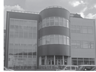
第2期計画で整備された YOMUNOSU