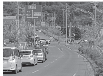
福祉の村へ向かう車避難の様子