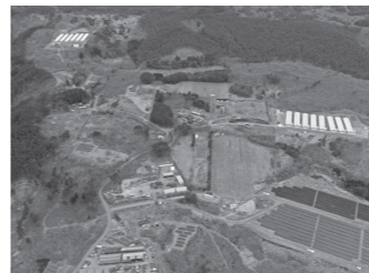
枝成沢広野の事業所群