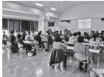
防災士養成研修講座