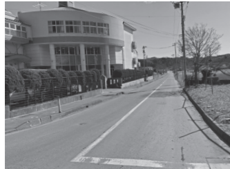
小久慈小脇の冠水する道路