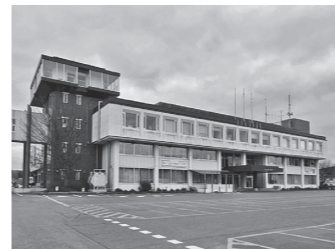
津波浸水想定区域にある本庁舎