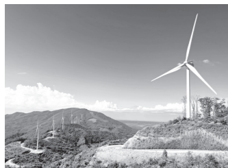
久慈市の近隣にある JRE 折爪岳南第一風力発電所