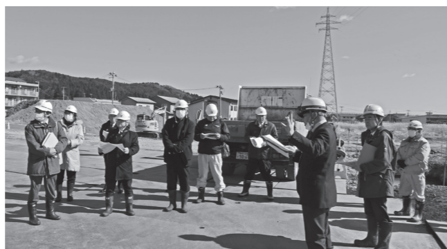
議案審査に向けた久慈湊小学校建設現場での確認