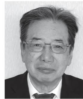
なかい せいいち 中居 正剛 (72歳)