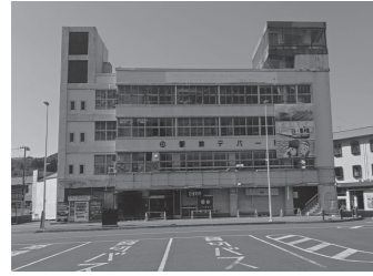
駅前賑わいを再び！

※市債の償還…建物などを整備するため、国や銀行から借り入れたお金を返済すること。