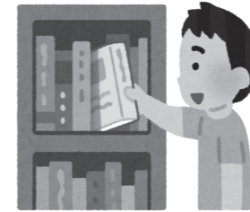
子どもの読書環境の充実を