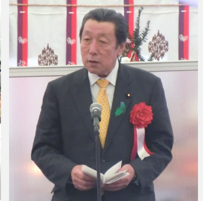
(長島復興大臣政務官あいさつ)