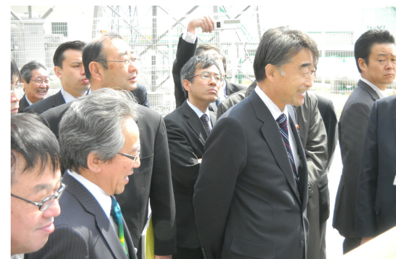
(手前右：根本復興大臣、手前右から2番目：山内市長)

根本復興大臣からは「被災地に寄り添い、一つ一つ課題を解決していきたい。これを契機に新しい地域づくりのお手伝いをしていきたい。」との所感が述べられました。