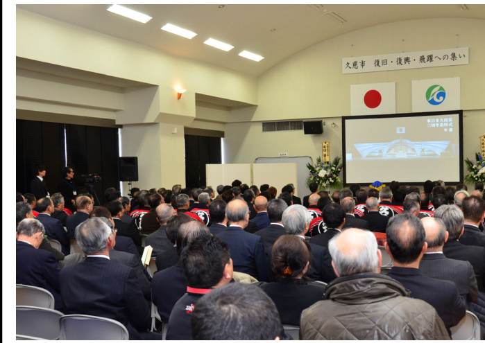
▲式典には国や県、市の関係者のほか消防団などが参加しました。

東日本大震災からの復旧・復興を進め、飛躍を目指す「久慈市 復旧・復興・飛躍への集い」が3月11日、国や県、市の関係者のほか、消防団など約250人が参加して防災センターで行われました。