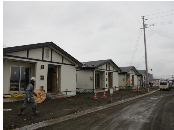
久慈湊・大崎地区