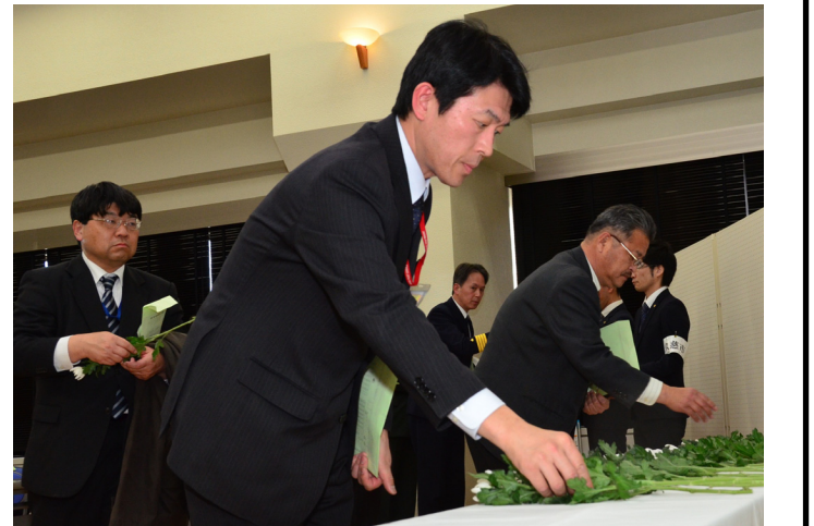
▲出席者全員が献花し、復興への思いを新たにしています。