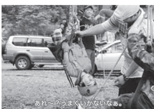
あれ〜?うまくいかないなあ。