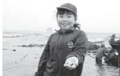
今日一番の大きなカニだよ