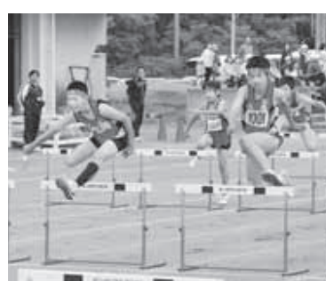
自分への挑戦、真剣なまなざし！

競技が始まりスタートラインに立つ選手たちは緊張の面持ちで、自分の出番を待っています。スタートの合図とともに飛び出す選手はその先待つ記録へ向けて全力で走りました。選手たちの全力での挑戦に、応援する児童、保護者も熱いエールを送りました。大会新記録も記録され、児童たちの次への挑戦にも期待がかかります。