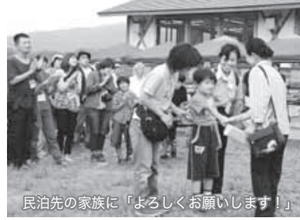
民泊先の家族に「よろしくお願ひします!」