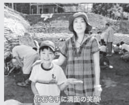
化石を手に満面の笑顔