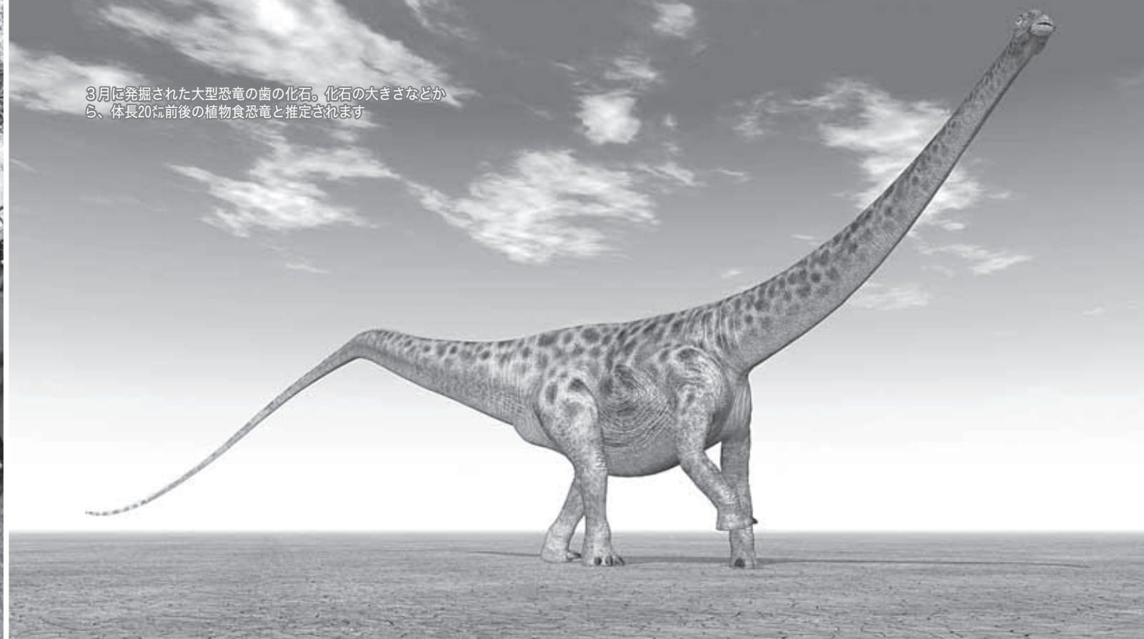
3月に発掘された大型恐竜の歯の化石。化石の大きさなどから、体長20メートル前後の植物食恐竜と推定されます