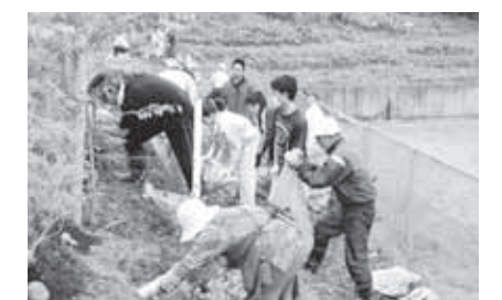
ゲンカイツツジとエゾムラサキツツジを植樹