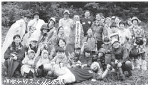
植樹を終えてハシヤリ