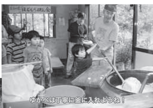
ゆかべは丁寧に釜に入れようね!