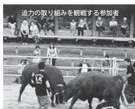
迫力の取り組みを観戦する参加者