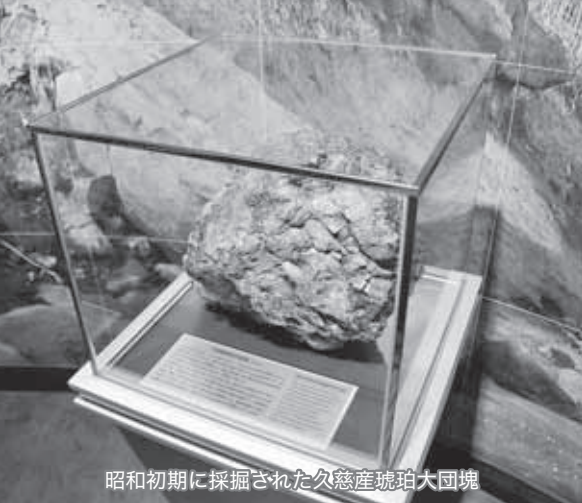
昭和初期に採掘された久慈産琥珀大団塊