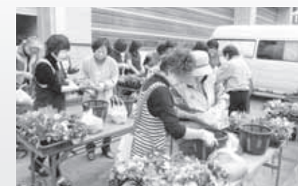
丁寧にバスケットを作成する参加者

6月23日、やませ土風館でハンギングバスケット（つり花籠）作りが行われ、市民ら約30人が参加しました。参加者らは1時間ほどかけてバスケットを完成。色とりどりの花が咲くハンギングバスケットは街なかの街路灯に設置され9月頃まで市民や観光客の目を楽しませてくれます。