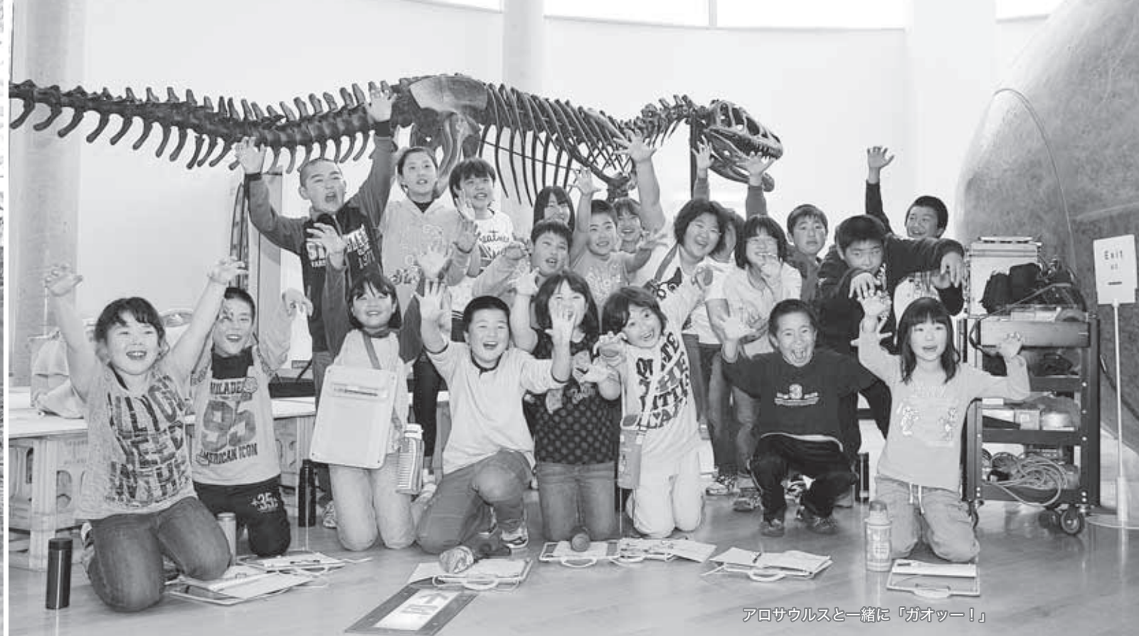
アロサウルスと一緒に「ガオッー！」