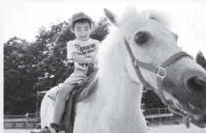
ポニーにまたがり笑顔の園児

乗馬とアニマルセラピーを考える会（渡邊史朗代表）は、5月から7月の間、県内の被災児童などが通う保育園を訪問し、ふれあい乗馬体験を行いました。7月11日には久喜保育園の園児がポニー馬車の乗車と乗馬を体験。園児たちは目を輝かせながらポニーの背中に乗って大満足の様子でした。