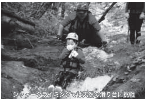
シャワークライミングでは天然の滑り台に挑戦