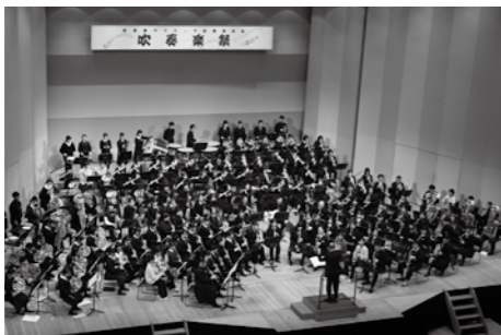
約150人が圧巻の演奏を披露した全体合同演奏

プロの演奏家や指導者を講師に吹奏楽の技術を学ぶ吹奏楽クリニックの成果発表会が、十文字チキンアンバーホールで開かれました。洋野町から普代村まで沿岸4市町村の生徒や一般の人が練習の成果を披露。最後には出演者全員がステージに立ち、心を一つに演奏しました。